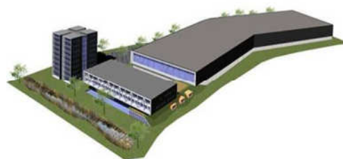
"Deventrade" prosjektet dekker et bruttoareal på over 21.000 m 2 . Prosjektet omfatter et 9 etasjer høyt tårn med kontorer, et lager og et design senter.